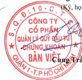
Cung Trần Việt