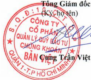
Cung Trần Việt